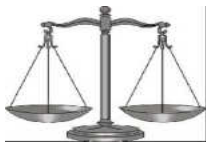
Tabla 6: Implementación de la Perspectiva de Género