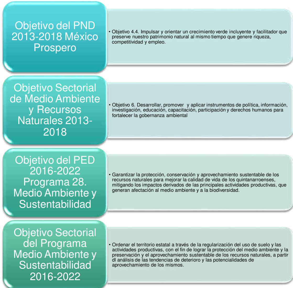
Figura 1. Alineación Estratégica

Fuente: Programa Sectorial de Medio Ambiente y Sustentabilidad 2016-2022