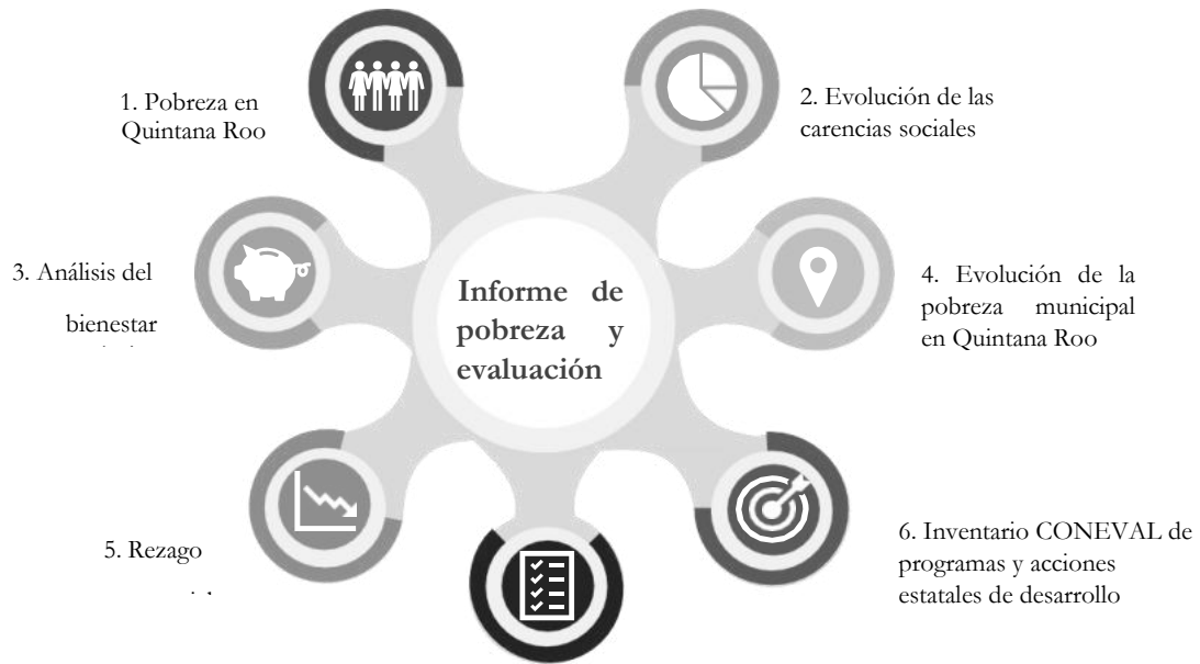
Figura 1. Capítulos del Informe de Pobreza y Evaluación 2018 para Quintana Roo