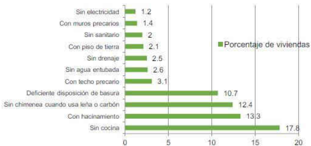
Gráfica 4.9 Principales rezagos en las viviendas de la entidad 2015

La entidad registró durante 2016 un millón 501 mil 562 personas y 441 mil 200 viviendas, en las cuales la carencia de cocina es el principal rezago en la vivienda, seguida del hacinamiento, la carencia de chimenea cuando se usa leña o carbón, techo precario, falta de agua entubada, drenaje, piso de tierra, carencia de sanitario, muros precarios y falta de acceso a la electricidad.